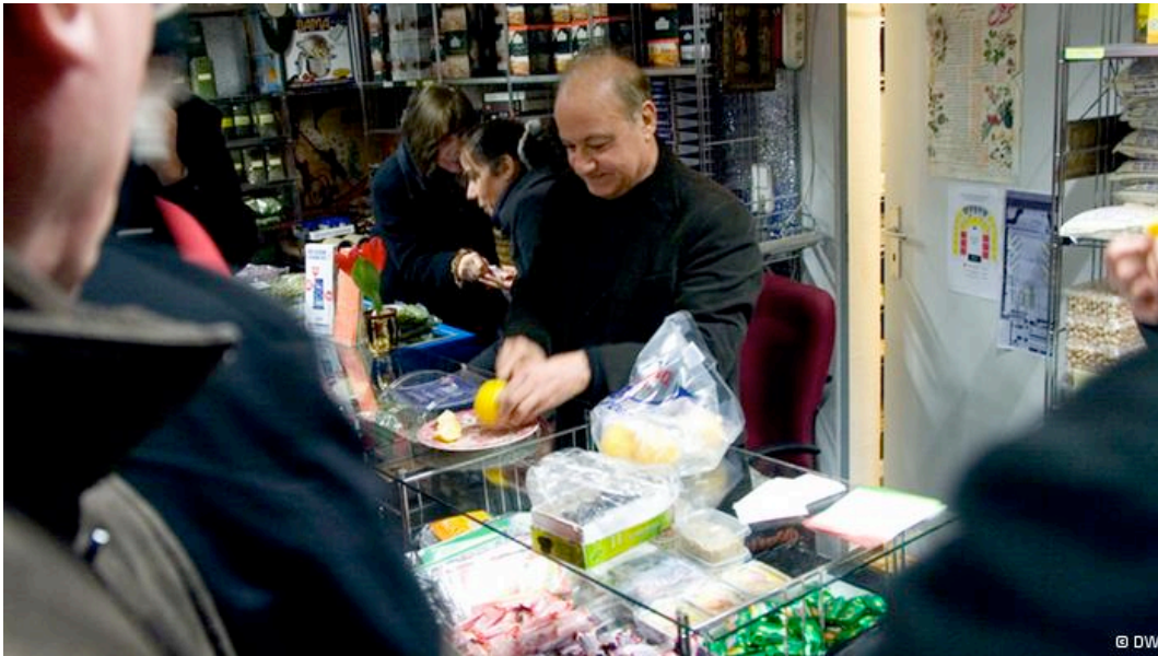
"Iran Shop" Mashallaha Bahrapoura

Broj sudionika njegovih multikulturnih šetnji Kölnom pokazuje da je Bönig pogodio potrebu mnogih u gradu. Oko 350 ljudi se svakog mjeseca prijavi za upoznavanje njima nepoznatog Kölna u jednom od 16 različitih obilazaka - od putovanja kroz afrički Köln do upoznavanja života indonezijskih stanovnika grada. Pomažu li ti obilasci doista dugoročno interkulturalnom razumijevanju stanovnika Kölna teško je provjeriti, ali je sasvim sigurno da se barem donekle pomaže razumijevanju stranih kultura koje postoje u gradu.