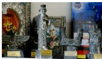
Upoznati vlastiti grad - da bi ga se bolje razumjelo

Ideju za pružanje mogućnosti drugačijeg pogleda na vlastiti grad je prije dvije godine imao Thomas Bönig. Njegova je želja bila da unaprijedi suživot stranaca i domaćih u multikulturnom Kölnu. S tim ciljem je pokrenuo inicijativu "Kulturklüngel", što bi se slobodno moglo prevesti kao "Kulturnjačko druženje".